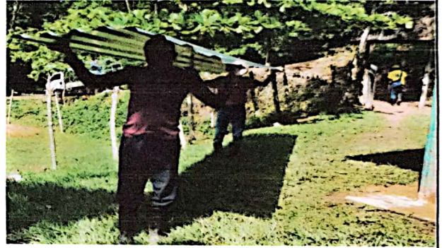
Foto 4: Se observa el ingreso de laminas troqueladas para la sustitución del techo.