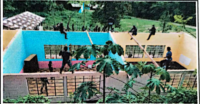
Foto 2: Se observa las paredes de la EORM Caserío Nuevo Tzulben ya sin techo