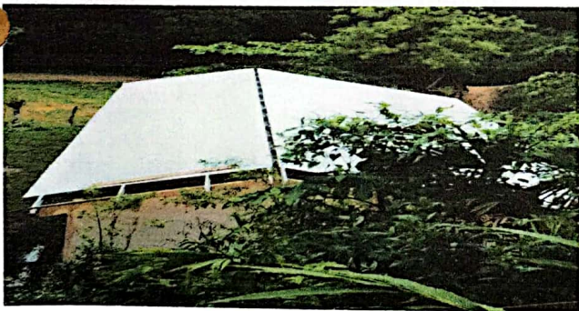
Foto 5: Se observa el avance de la sustitución del techo del Edificio Escolar Público