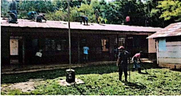
Foto 1: Se observa el inicio del trabajo de remozamiento por los padres de familia